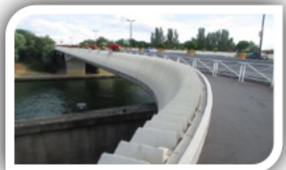
Pont de Puteaux