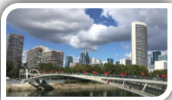
Passerelle de Puteaux