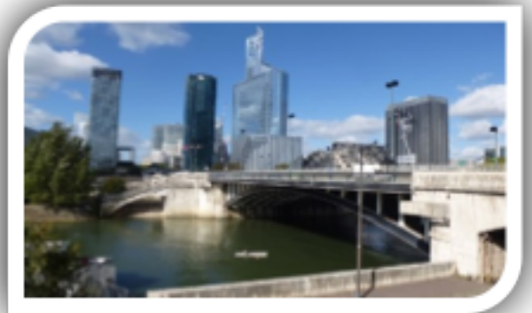
Pont de Neuilly