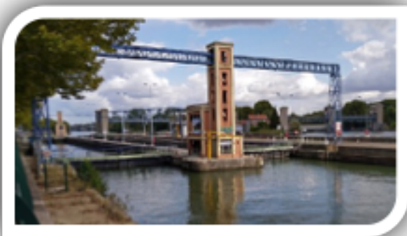
Barrage de Suresnes