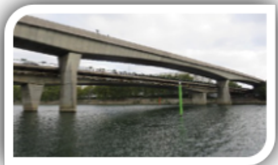
Pont de Clichy