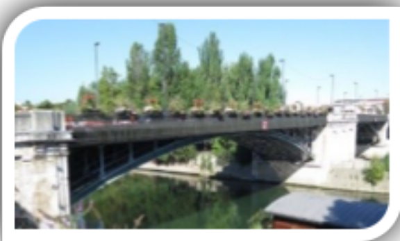
Pont de Levallois

Les 2 selfies devront être envoyés à l'application comptoir des pêcheurs ( dans la catégorie photos d'ambiance ) pour validation et les photographies devront présenter les deux lieux comme les exemples ci-joints :